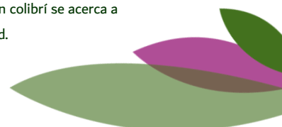
DERLY MARITZA FIRACATIVE MORALES Gestion Documental.